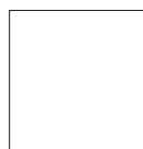
Blanc RAL 9010